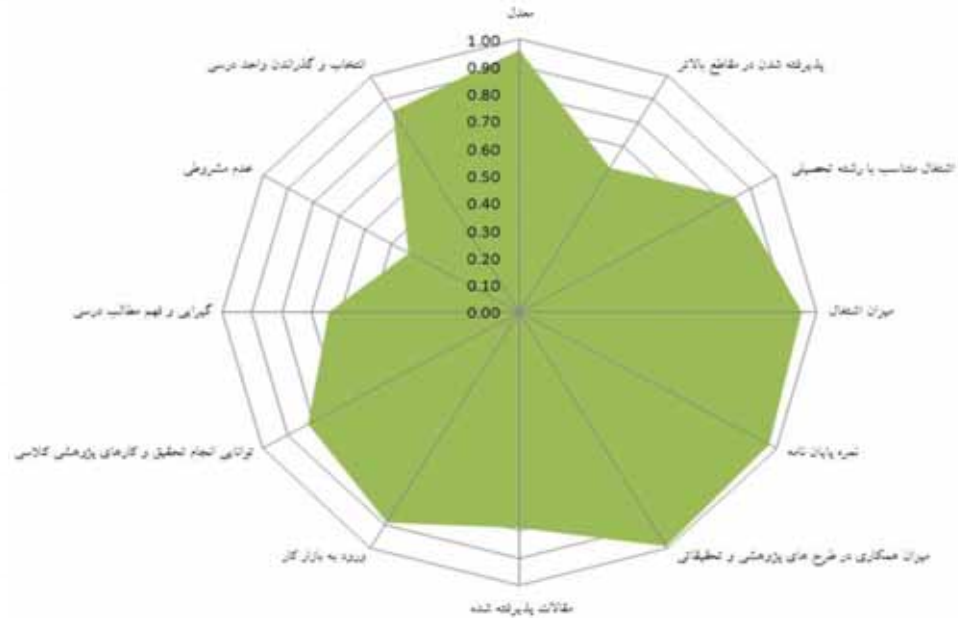
جدول ۲ - بررسی نظر اساتید پیرامون وضعیت تحصیلی دانشجویان پذیرفته شده با کنکور و بدون کنکور

مقایسه نمره گزینش و فهم مطالب درسی دانشجویان پذیرش شده بدون آزمون و با آزمون